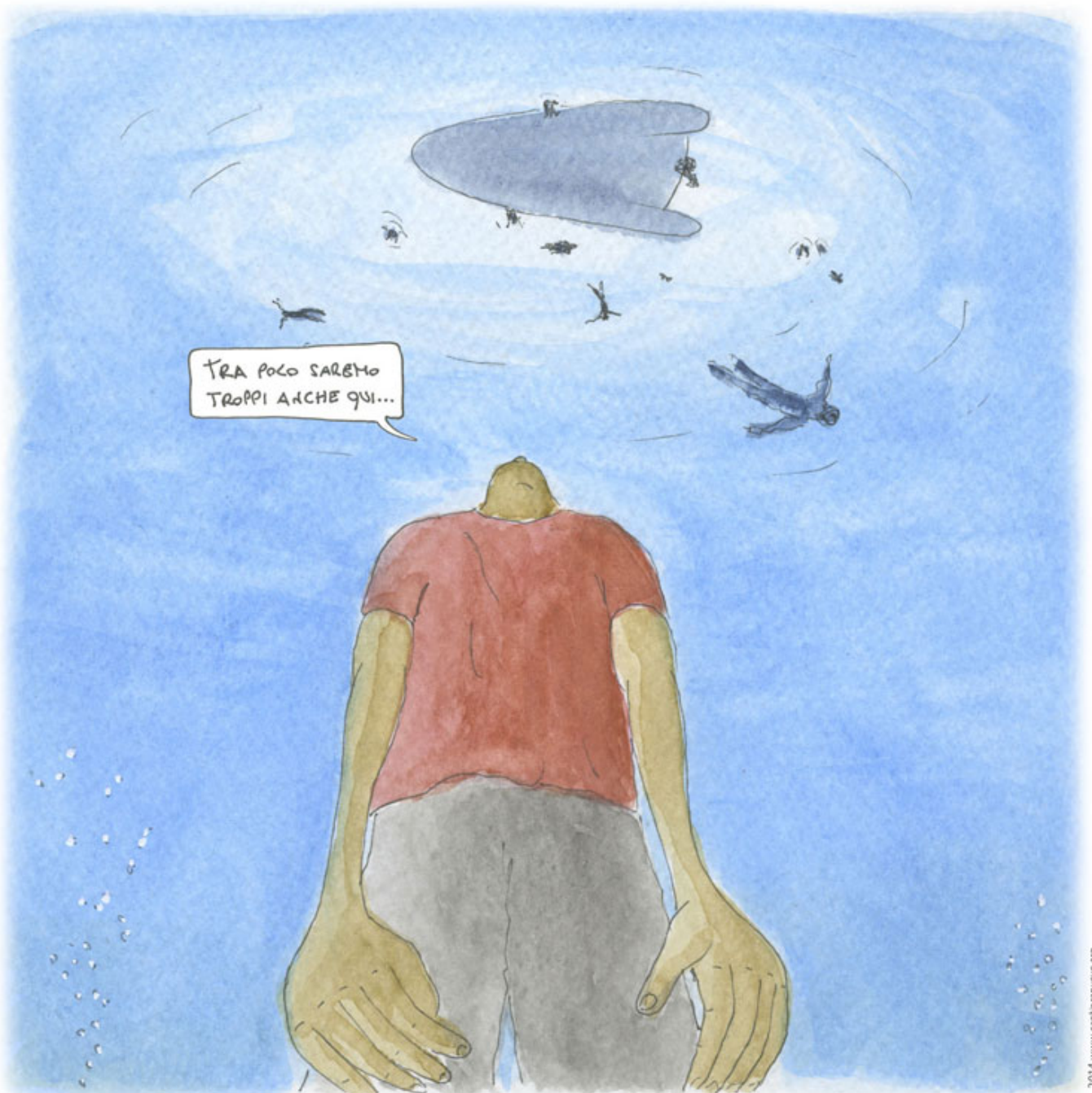
Lampedusa - 3 ottobre 2013, per non dimenticare